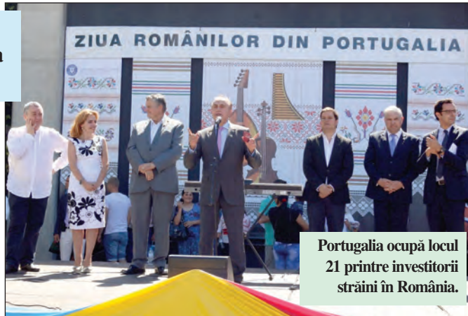
Portugalia ocupă locul 21 printre investitorii străini în România.

- Înainte de a veni la post în Portugalia, ați fost ambasador în Maroc, în spațiul arab nord