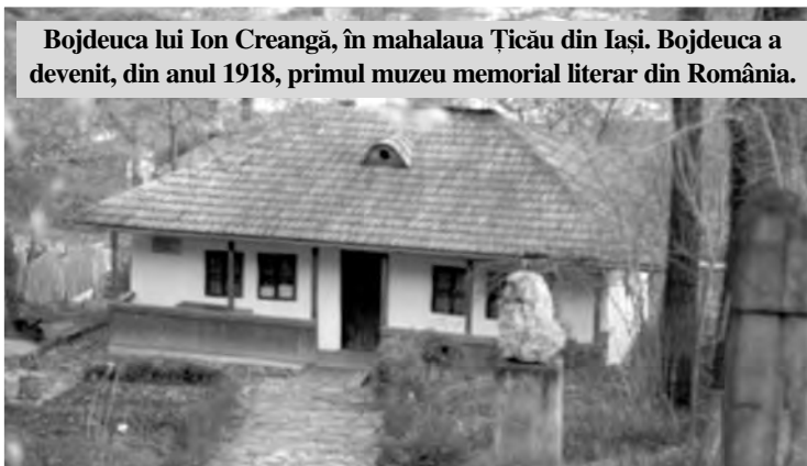
Bojdeuca lui Ion Creangă, în mahalaua Țicău din Iași. Bojdeuca a devenit, din anul 1918, primul muzeu memorial literar din România.