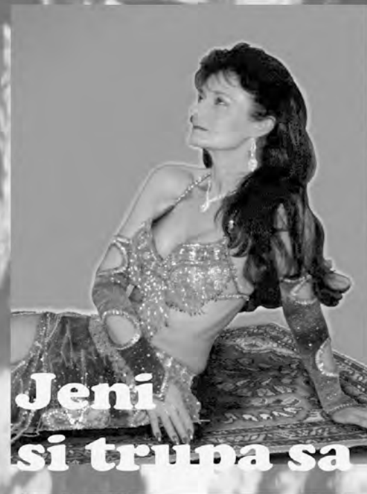
Jeni si trupa sa