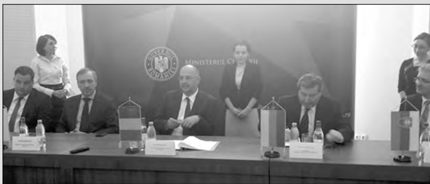
România a aderat miercuri la declarația comună privind înființarea Rețelei Europene pentru Memorie și Solidaritate, alături de țările fondatoare Germania, Polonia, Slovacia și Ungaria.