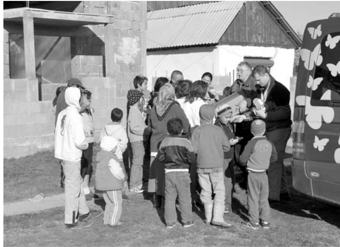
Lodes din Hinterkleebach.