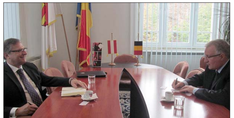
Austria Superioară. „Județul Sibiu și orașul Sibiu reprezintă pentru Austria