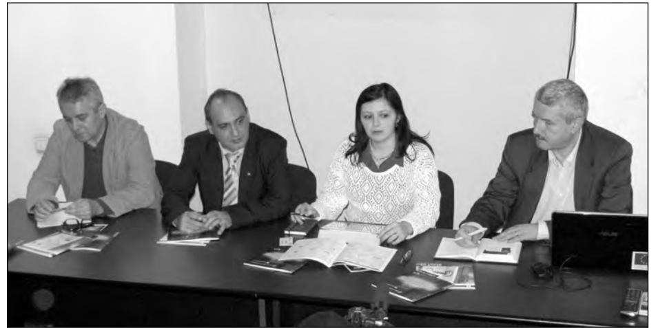
49-a ediții a Conferinței de Securitate.

Este un pas important care se înscrie în tema discuțiilor avute de dl. Ministru de Externe Titus Corlățean cu Ministrul Federal de Externe german, dl. Guido Westerwelle, la München, în data de 2 februarie 2013, cu ocazia celei de-a